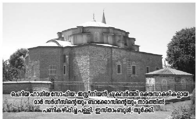
ചെറിയ ഹാസിയ ബോഫിയ- ഇസ്റ്റിനിയൻ ചക്രവർത്തി രക്തസാക്ഷികളായ മാർ സർഗീസിന്റെയും ബാക്കോസിന്റെയും നാമത്തിൽ പണികഴിപ്പിച്ച പള്ളി. ഇസതാംബുൾ, തുർക്കി.

ഉപേക്ഷിക്കുവാനും ദേവന്മാരെ ആരാധിക്കുവാനും ആലോചിച്ചു. അതിനു മറുപടിയായി “ഞങ്ങൾ സകലവും ഉപേക്ഷിച്ചു ക്രിസ്തുവിനെ പിൻപറ്റി വ്യർത്ഥമായ ഭൗമിക ബഹുമാനത്തെ ഉപേക്ഷിച്ചു സ്വർഗ്ഗീയ മാലാഖമാർക്ക് സഖാക്കളായി തീർന്നു. കളങ്കപങ്കിലമായ ഭൗതിക സമ്പത്തിനെ മറന്ന് സ്വർഗ്ഗീയ നിക്ഷേപത്തിനായി കാംക്ഷിക്കുന്നു” എന്ന് സർഗ്ഗീസ് പറഞ്ഞു. കുപിതനായ ന്യായാധിപൻ സർഗ്ഗീസിന് മരണശിക്ഷ നൽകി. സർഗ്ഗീസിന്റെ പാദങ്ങളിൽ ആണികൾ തറച്ചു കയറ്റുകയും കൊടിയ പീഡനങ്ങൾക്കുശേഷം ശിരഛേദം ചെയ്യുകയും ചെയ്തു. ശിരഛേദം ചെയ്യപ്പെടുമ്പോൾ “എന്റെ ആത്മാവിനെ നിന്റെ തൂക്കൈകളിൽ ഏൽപ്പിക്കുന്നു. പിശാചുക്കളുടെ കൈയിൽ നിന്ന് എന്നെ രക്ഷിക്കണമെ” എന്ന് പ്രാർത്ഥിച്ചതായും സ്വർഗ്ഗത്തിൽ നിന്ന് “ജയാളിയായ